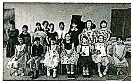
(写真) 前回の豊田地区より